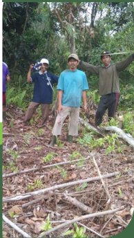
Pengolahan lahan untuk demoplot