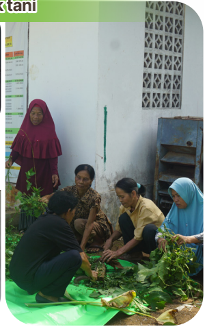
Pelatihan pembuatan pupuk organik