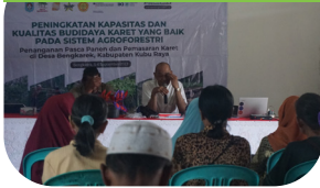
Pelatihan budidaya karet