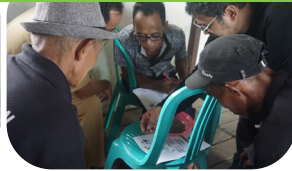
Pelatihan penanganan pasca panen kopi