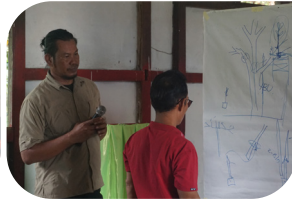
Pelatihan pembiakan vegetatif