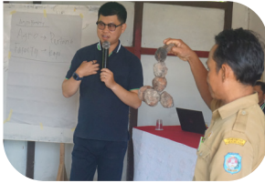
Pelatihan penanganan pasca panen karet