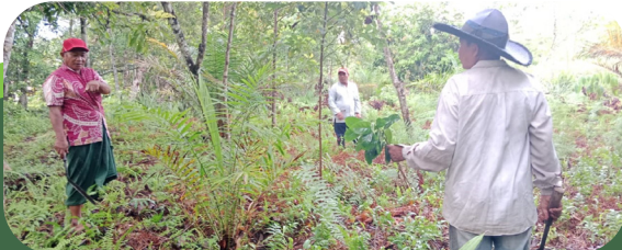
Penanaman bibit kopi di lahan masyarakat untuk mengisi tempat kosong diantara tanaman karet