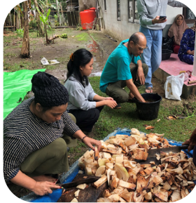
Pelatihan pembuatan pupuk organik