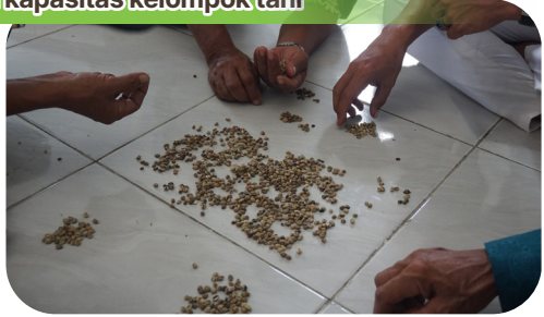
Pelatihan penanganan pasca panen kopi