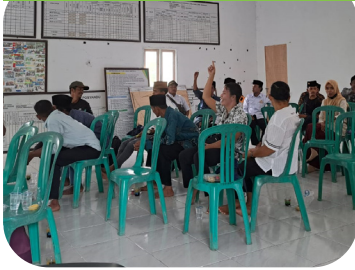
Pelatihan budidaya karet