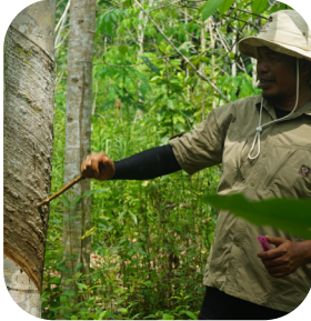
Pelatihan penyadapan karet