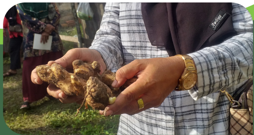
Pelatihan budidaya tanaman rimpang

Rahayu S, Suyanto, Hartiyadi R, Ismawan IN. 2024. Model Usahatani Agroforestri Karet di Desa Penangoan Duren, Kecamatan Tulung Selapan, Kabupaten Ogan Komering Ilir . Bogor, Indonesia: World Agroforestry (ICRAF).