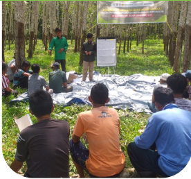
Pelatihan pembuatan pupuk organik