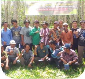
Pelatihan budidaya karet dan buah-buahan dalam sistem agroforestri