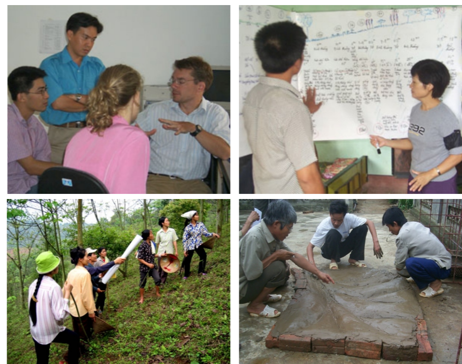
Hình 2. Hoạt động theo nhóm trong phần nội nghiệp

Nhóm nghiên cứu gồm 3 người Việt Nam và 3 nghiên cứu viên và sinh viên Thụy Sĩ, với thời gian nghiên cứu tại hiện trường là 9 ngày. Trong đó 5 ngày làm việc ngoài trời cùng với 14 người dân địa phương; 4 ngày còn lại thực hiện công việc nội nghiệp. (Hình 2 và 3). Não công là công cụ sử dụng chính cho hoạt động nhóm trong suốt quá trình khảo sát. Tất cả các khái niệm, định nghĩa và phương pháp đã được thảo luận và thống nhất giữa các thành viên trong nhóm. Báo cáo nhanh, bao gồm tất cả những số liệu thu thập được trong ngày được ghi chép trong biểu mẫu, đã được hoàn thành sau mỗi ngày đi hiện trường nhằm đảm bảo tất cả thông tin thu thập được tài liệu hóa một cách hợp lý. Phương pháp và công việc của ngày làm việc kế tiếp cũng được xem xét và thống nhất. Phỏng vấn sử dụng câu hỏi mở được tiến hành bởi tất cả các thành viên trong nhóm cũng như người cung cấp thông tin một cách đồng đều. Những phản hồi của người dân địa phương được thu thập trong suốt quá trình nghiên cứu.