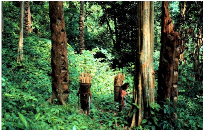
Gambar 4. Agroforest Kompleks: Kebun damar di Krui, Lampung Barat (De Foresta et al, 2000)

Dibandingkan sistem agroforestri sederhana, struktur dan penampilan fisik agroforest yang mirip dengan hutan alam merupakan suatu keunggulan dari sudut pandang pelestarian lingkungan (Gambar 4). Pada kedua sistem agroforestri tersebut, sumberdaya air dan tanah dilindungi dan dimanfaatkan. Kelebihan agroforest terletak pada pelestarian sebagian besar keaneka-ragaman flora dan fauna asal hutan alam.