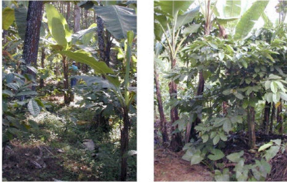
Gambar 1. Sistem agroforestri sederhana di Ngantang, Malang Jawa Timur. Kopi dan pisang ditanam oleh petani di antara pohon pinus milik Perum Perhutani (Gambar kiri). Gliricidia dan pisang ditanam sebagai naungan pohon kopi (Gambar kanan).