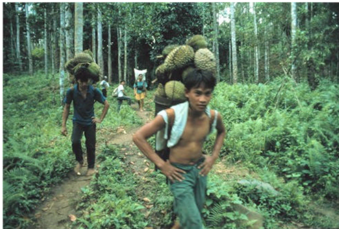
Gambar 6. Durian: Salah satu hasil tambahan

Ciri keluwesan yang lain adalah perubahan nilai ekonomi yang mungkin dialami beberapa spesies. Spesies yang sudah puluhan tahun berada di dalam kebun dapat tiba-tiba mendapat nilai komersil baru akibat evolusi pasar, atau pembangunan infrastruktur seperti pembangunan jalan baru. Hal seperti ini telah terjadi pada buah durian, duku, dan cengkeh serta terakhir kayu ketika kayu dari hutan alam menjadi langka.