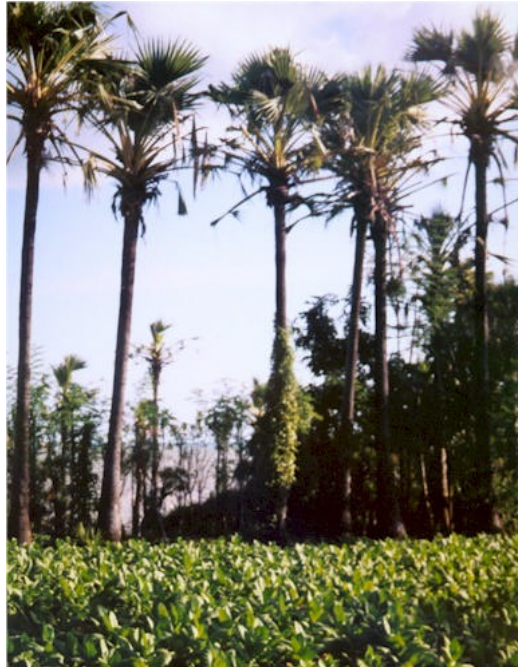
Gambar 2. Agroforestri Sederhana: Tembakau ditanam di antara barisan pohon siwalan di Sumenep, Madura.

Perpaduan pohon dengan tanaman semusim ini juga banyak ditemui di daerah berpenduduk padat, seperti pohon-pohon randu yang ditanam pada pematang-pematang sawah di daerah Pandaan (Pasuruan, Jawa Timur), kelapa atau siwalan dengan tembakau di Sumenep–Madura (Gambar 2). Contoh lain, tanah-tanah yang dangkal dan berbatu seperti di Malang Selatan ditanami jagung dan ubikayu di antara gamal atau kelorwono ( Gliricidia sepium ).