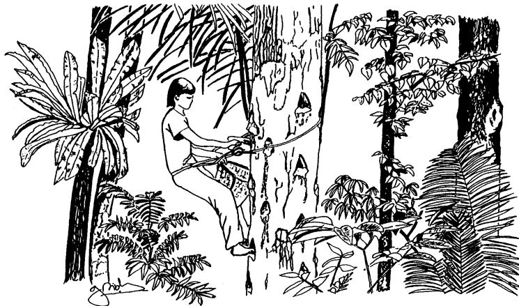
Gambar 7. Pemanenen getah damar (Michon dan de Foresta, 2000).

Sejak tahun 1960-an bentuk pengelolaan hutan yang dikembangkan terpaku pada pengusaha kayu gelondongan. Kayu gelondongan merupakan unsur dominan hutan yang relatif sulit diperbaharui. Eksploitasinya mengakibatkan degradasi drastis seluruh ekosistem hutan. Hal ini memunculkan suatu usulan agar pihak-pihak kehutanan dalam arti luas mengalihkan perhatiannya pada hasil hutan non kayu (disebut juga hasil hutan minor) misalnya damar, karet remah dan lateks, buah-buahan, biji-bijian, kayu-kayu harum, zat pewarna, pestisida alam, dan bahan kimia untuk industri obat. Ilustrasi yang disajikan pada Gambar 7 adalah pemanenan hasil hutan non-kayu berupa getah damar selain produksi kayu yang cukup menarik petani di daerah Krui, Lampung Barat. Pemanenan hasil hutan non-kayu merupakan pengembangan sumberdaya yang dapat mendukung konservasi hutan karena mengakibatkan kerusakan yang lebih kecil dibandingkan dengan pemanenan kayu.