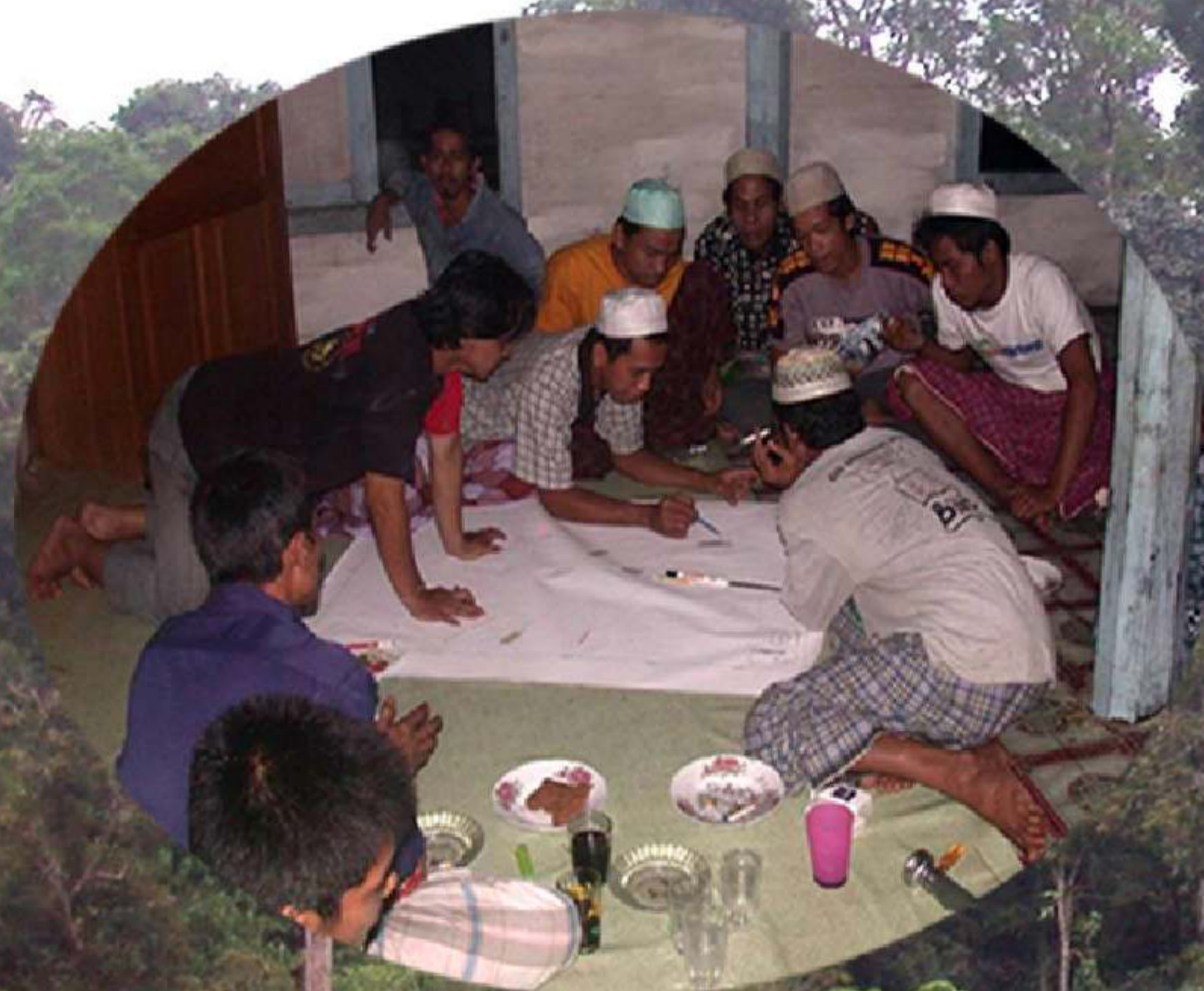
Proses pemetaan kawasan kelola