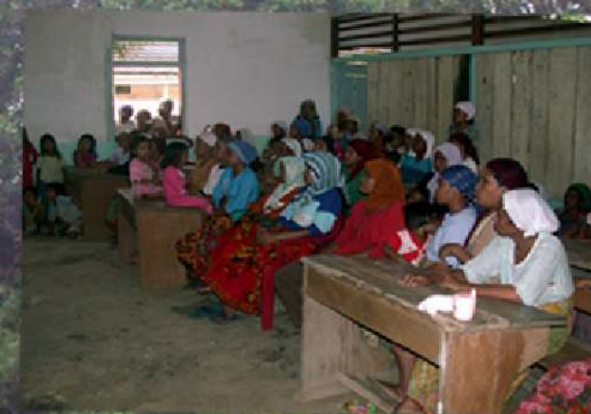
Keterlibatan kaum perempuan dalam pemetaan