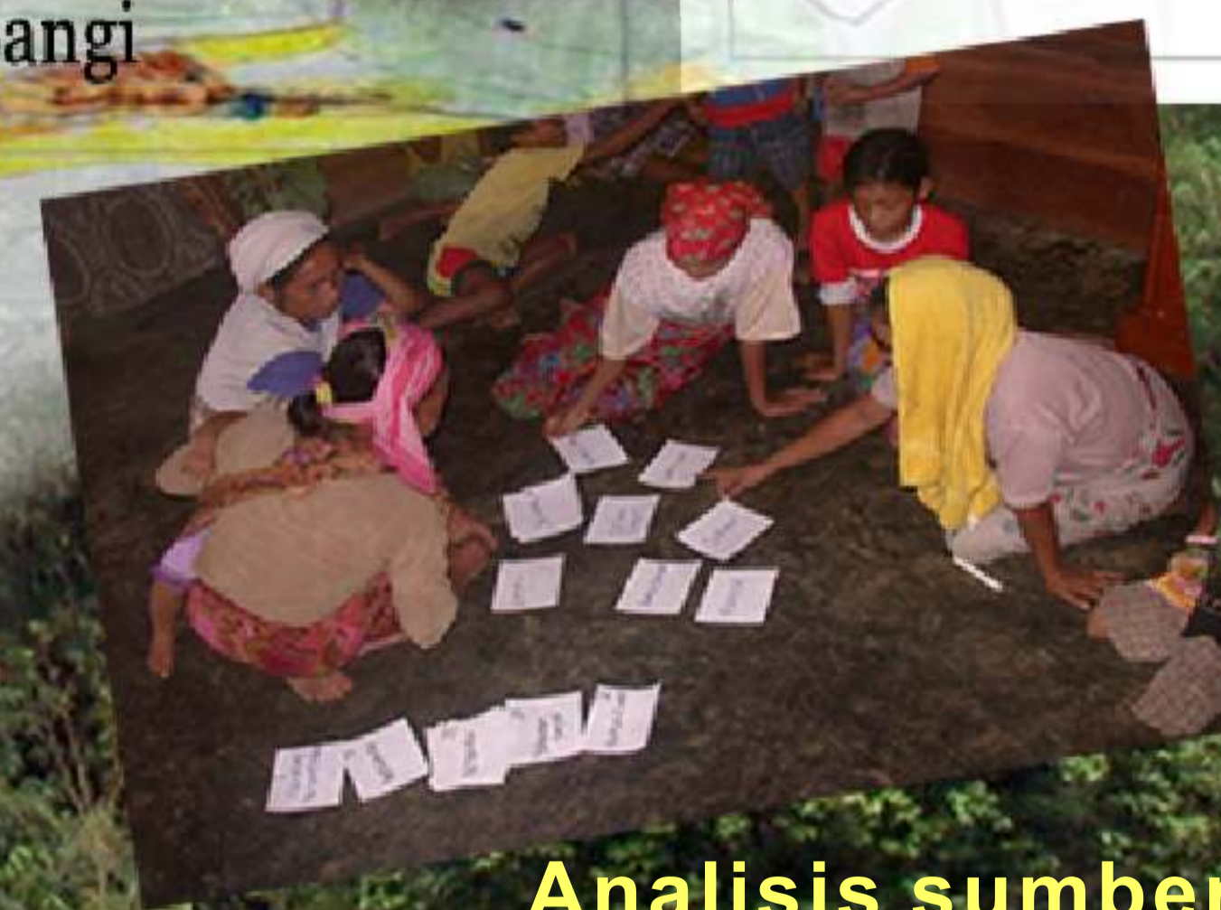
Analisis sumber penghidupan