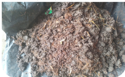
Tandan kosong ditambah hijauan dan kotoran hewan dengan EM4 sebagai decomposer pada proses 1 bulan