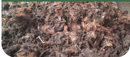
Tandan kosong dengan promi sebagai decomposer pada proses 1 bulan