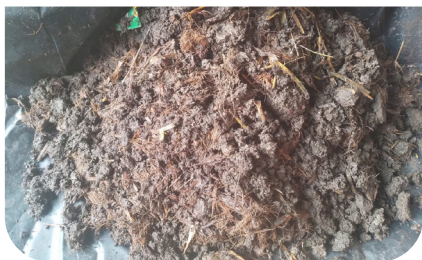
Tandan kosong dengan EM4 sebagai decomposer pada proses 1 bulan