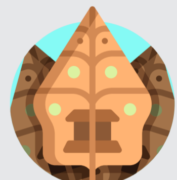
Sesuai adat dan budaya