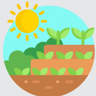
Kebun dan Sawah