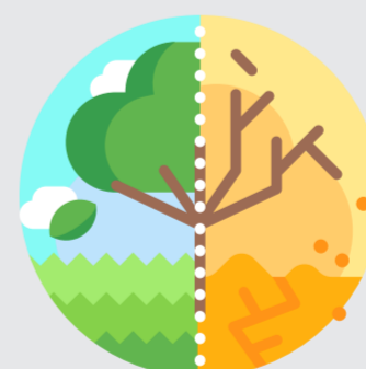
Tahan Krisis alam