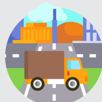
Adanya infrastruktur dan kendaraan