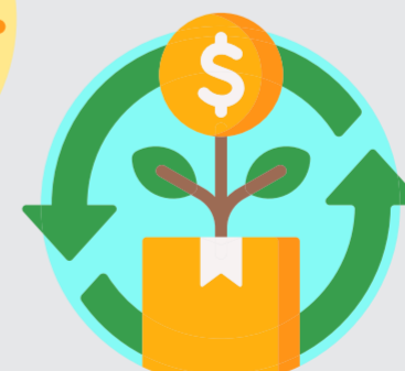
Tahan krisis ekonomi