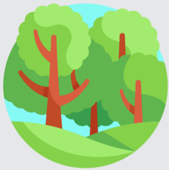
Alam dan Hutan