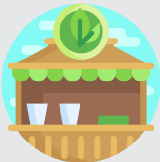
Pasar dan toko